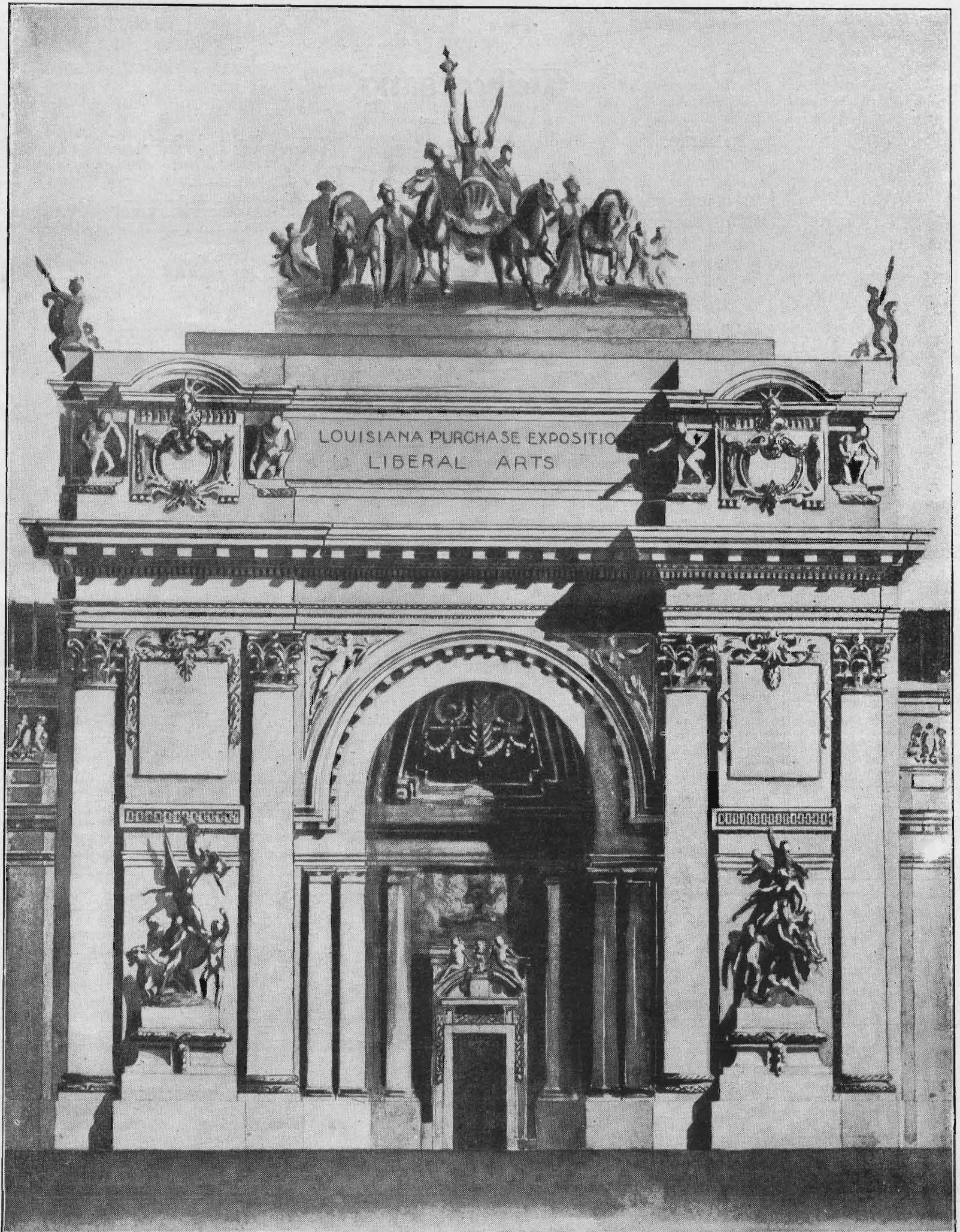
Das Gebäude für Kunstgewerbe.